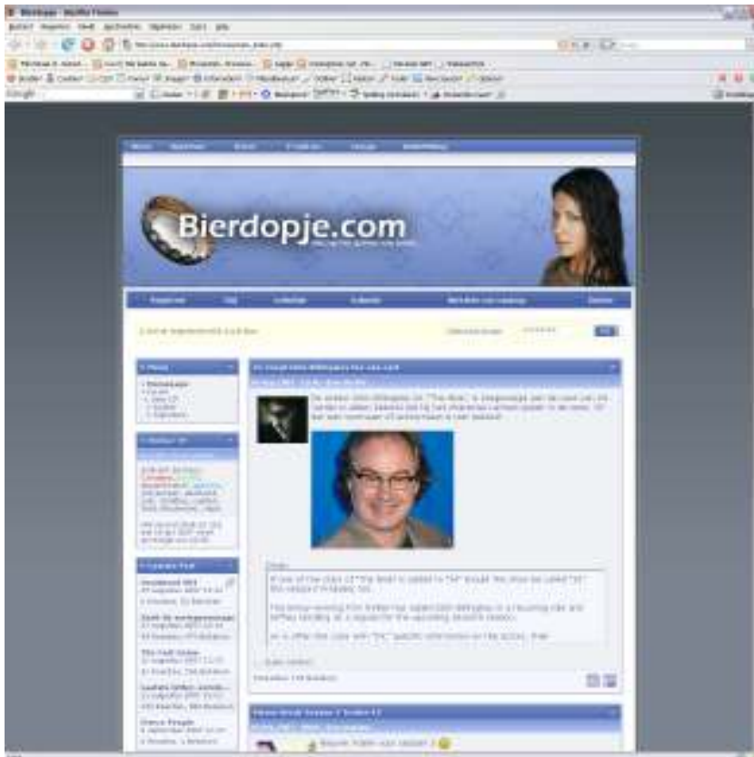
1. De homepage